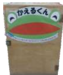
ブックポスト「かえるくん」