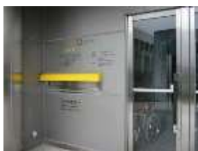
サラダホール正面入り口 ブックポスト

ブックポスト「かえるくん」に返却の場合、返却情報の更新は、図書館が本を回収した時点になります。入れた時点では更新されませんので、ご了承ください。