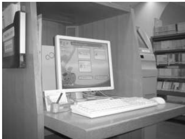
↑ 이용자 말단기기 (OPAC)

개관 시간 오전 10 시~오후 5 시 공휴일 이외의 금·토요일은 오후 7 시까지